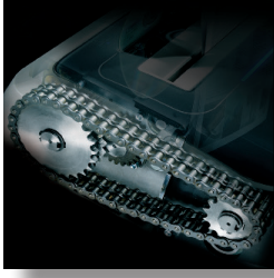
Çelik dişlerle yoğun zincir sürüşü