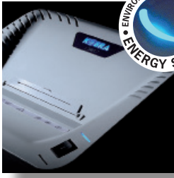
Stand by modunda sıfır enerji tüketimi sağlamak için ışıklı optik göstergeli ENERGY SMART® yönetim sistemi