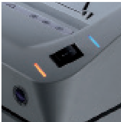
Kapak açık ve atık haznesi dolu ikaz LED'i ile ON-OFF REVERSE tuşları ile kolay kullanım.

KOBRA 240.1 serisi düz kesim, çapraz kesim ve yüksek güvenli kesim özelliğine sahip üstün performanslı 7 değişik modeli içerir. Kobra 240.1 sürekli işlev gören güçlü motoru, sağlam çelik dişleri ve metal zincir " Süper Potansiyel Güç Ünitesi" sürüş sistemiyle hemen hemen herşeyi imha edebilir. CD-ROMları, manyetik diskleri, kağıdı, ataç zımba telini imha edebilen Kobra 240.1 S4 ve 240.1 S5 multi medya imha edicilerin inanılmaz performansından hiç bahsetmiyoruz. Bütün modeller stand by modunda güç tasarrufu yapmak ve çevreyi korumak için optik olarak aydınlatılmış etkili göstergeye sahip ENERGY SMART® sistemiyle donatılmıştır.