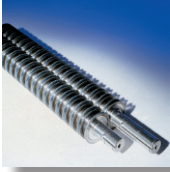
Özel olarak tasarlanmış karbonla güçlendirilmiş kesici bıçaklar CD-ROM, DVD, Disket ve kağıt imha edebilir..