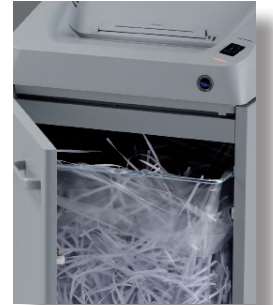
135 litre yüksek hacimli kabin.