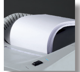
Güçlü kesici bıçaklar yüksek imha kapasitesi sağlar.