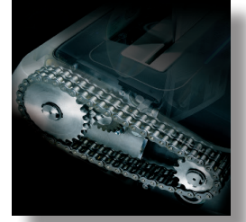
Çelik dişlerle yoğun zincir sürüşü