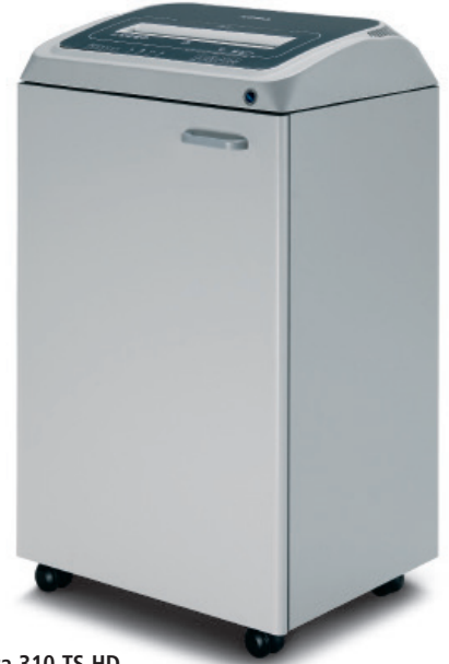
Kobra 310 TS HD

OTOMATİK GERİ ALMA sıkışma halinde otomatik geri alma