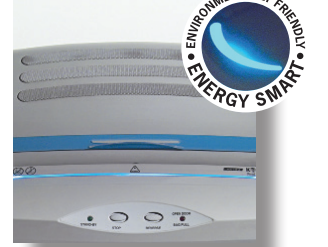
Stand by modunda sıfır enerji tüketimi sağlamak için ışıklı optik göstergeli ENERGY SMART® yönetim sistemi