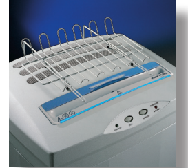
Ayarlanabilir sürekli form üst rafı "Yer tasarruf dizaynı" (raf dahil değil) Entegre edilmiş kaygan düz disketlerin, CD, DVD ve Kredi kartların imhasını kolaylaştırır.