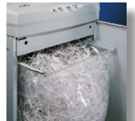
200 litre kolay çıkarılabilir kabin.