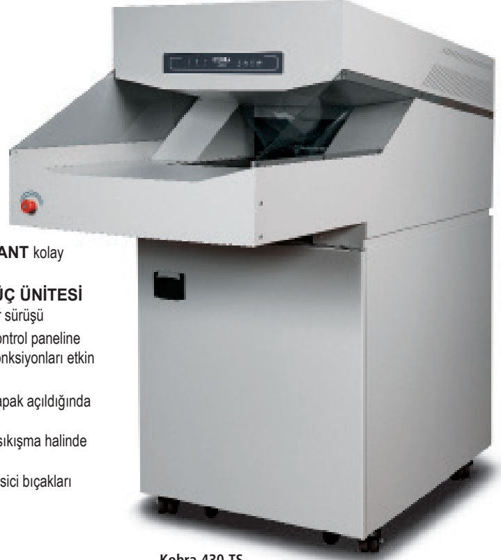
Kobra 430 TS

Özel yağ kabı bulunduran sağlam ve büyük hacimli 470 lt çelik kabin.