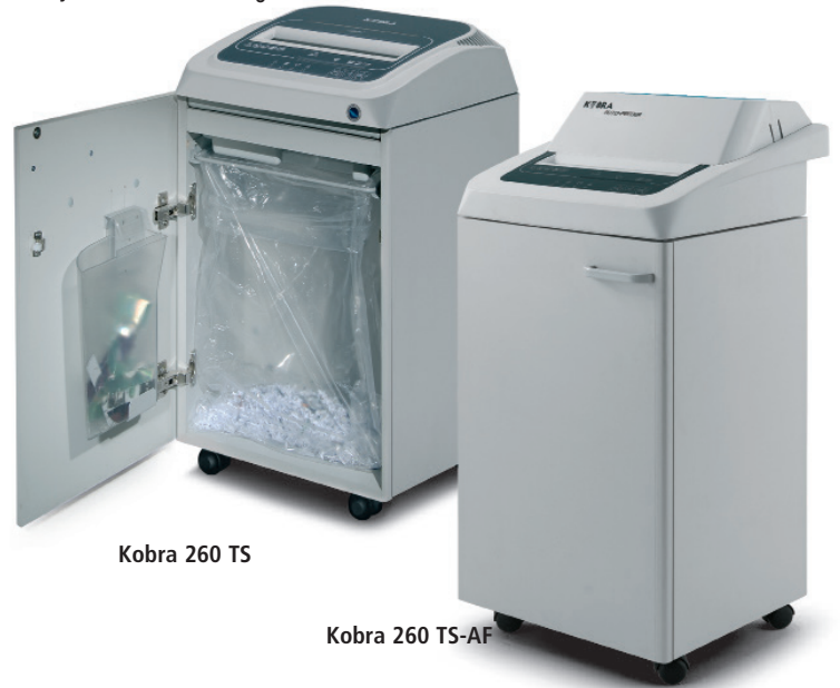
Kobra 260 TS

2 farklı giriş ağızları ile kağıt, CD, DVD ve Kredi Kartlarını parçalama, parçalanmış materyalleri 2 farklı çöp kovasına ayrı ayrı koyma işlemi için 2 takım kesme bıçağı.